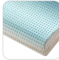
Air Fresh Cervical wymiary: 40x70x12/9 cm