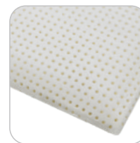
Air Relax wymiary: 42x72x14 cm