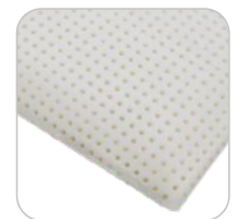
Tencel Air Relax wymiary: 42x72x13 cm 42x72x15 cm

Wszystkie poduszki MOONPUR/MOONTEX/TENCEL objęte są 5 letnią gwarancją na rdzeń oraz 2 letnią gwarancją na pokrowiec.