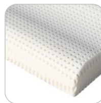
Air Cervical wymiary: 40x70x12/9 cm