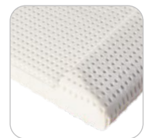
Air Special wymiary: 40x68x14/8 cm