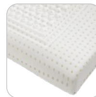
Tencel Air Cervical wymiary: 40x70x12/9 cm