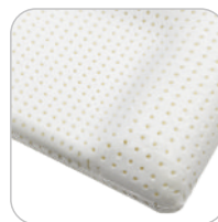
Tencel Air Special wymiary: 42x72x12/9 cm